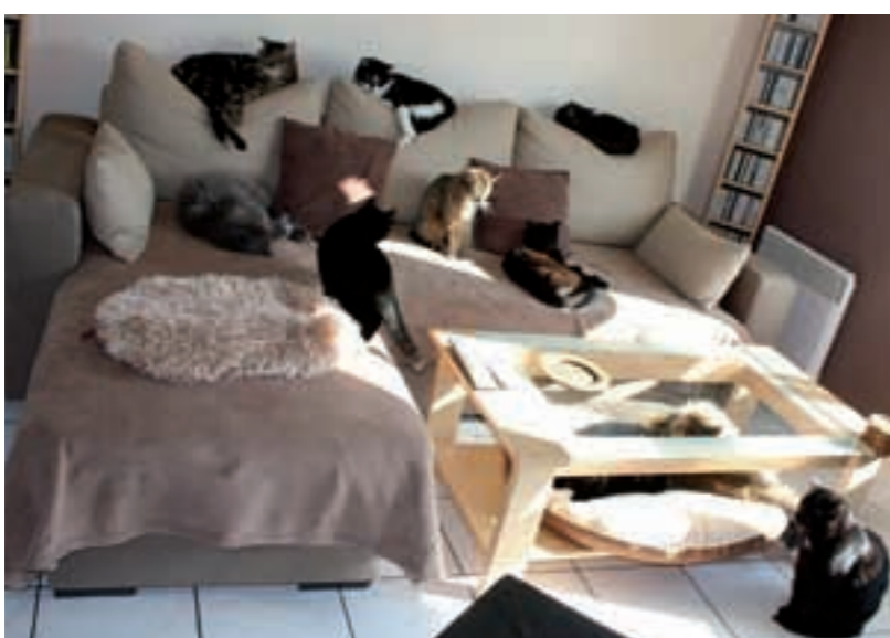
L'heure de la sieste chez Gaëlle.