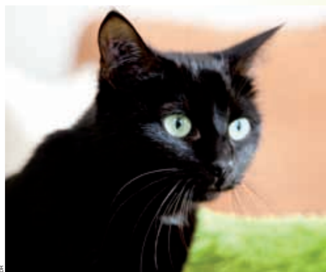
Salem abandonnée car "peu utile étant adulte" cherche famille d'adoption.